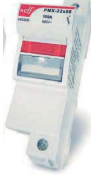
PMX-PV 14x51 32 A