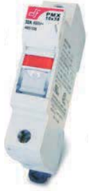
PMX-PV 10x38 20 A

10 x 38 ve 14 x 51 sigortalar için (1100VDC)